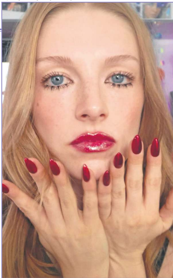
As maquiagens de Jules na terceira temporada estão entre as favoritas