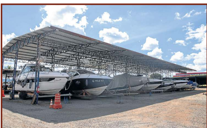
Aluguéis de embarcações podem ser fechados na marina

*Estagiária sob a supervisão de Adriana Bernardes