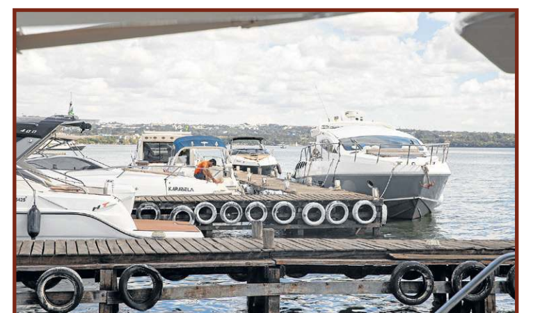
Setor movimentou a economia e gera empregos na capital do país