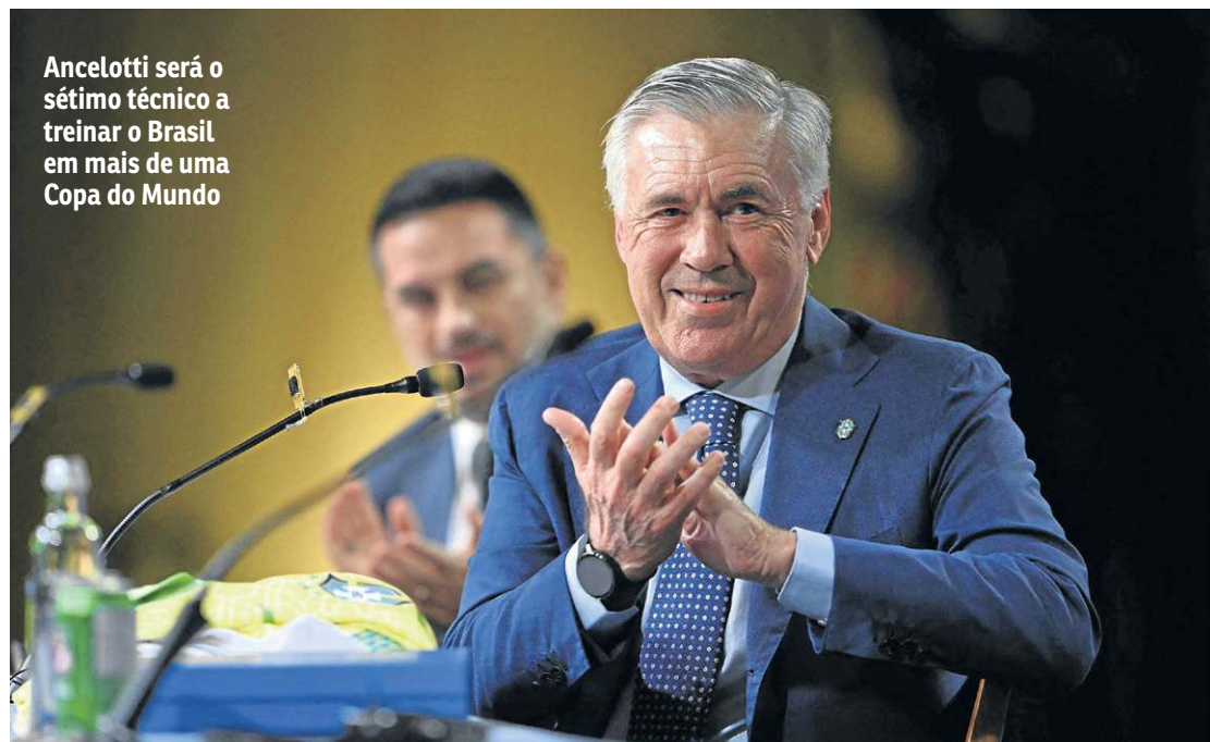
Ancelotti será o sétimo técnico a treinar o Brasil em mais de uma Copa do Mundo

A Confederação Brasileira de Futebol (CBF) cumpriu o prometido e renovou o contrato com o técnico Carlo Ancelotti antes do anúncio final dos convocados para a Copa do Mundo, agenda para segunda-feira. Ontem, a entidade anunciou acordo com o italiano até o Mundial de 2030.