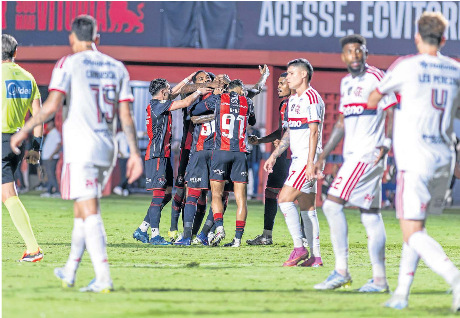
Vitória alcançou cinco jogos de invencibilidade ao derrotar o Flamengo no Barradão e chegou ao 12º triunfo em 18 partidas como mandante

rara felicidade da entrada da área e colocou a bola no ângulo. Batido, o goleiro Rossi sequer tirou os pés do chão para tentar alcançá-la: 1 x 0. Zerrar a vantagem do Flamengo logo na largada do duelo deu tranquilidade para os donos da casa. Os visitantes demoraram para engrenar. Quando conseguiram, pararam em Aranjó. O goleiro pegou finalizações de Everton Araújo, Luiz Araújo (duas vezes), Bruno Henrique e Jorginho.