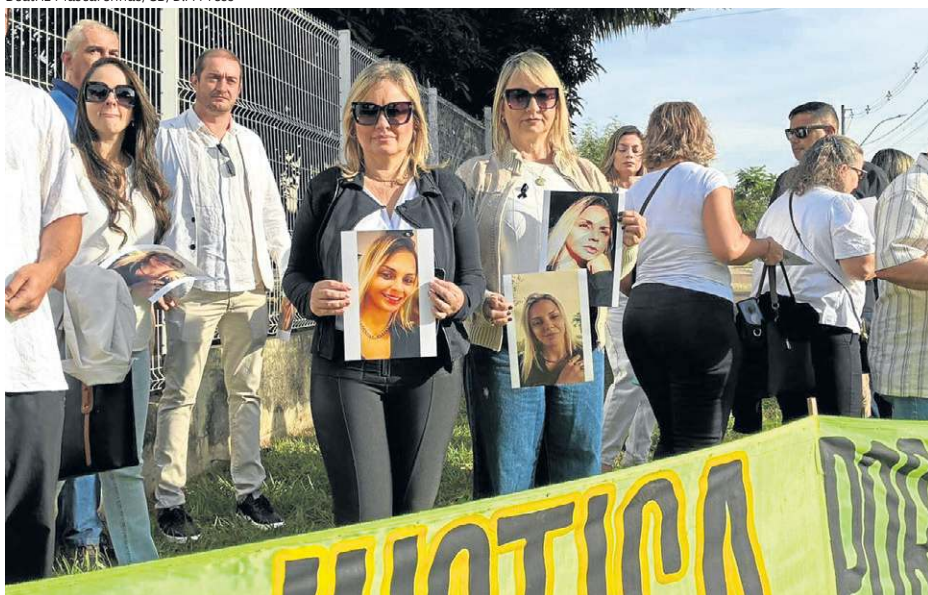
Mãe e tia cobram por justiça em ato em frente ao Fórum do Guará