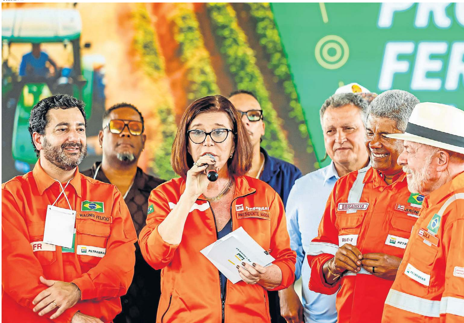
A presidente da Petrobras afirmou que a estatal busca tornar o país autossuficiente no refino de diesel e gasolina até 2030

governo “assumiu a responsabilidade” de não repassar ao consumidor. “A gente vai continuar trabalhando. Estão vendo a guerra do Irã? A guerra que o (presidente dos Estados Unidos) Trump inventou. Essa guerra está aumentando a gasolina e o óleo diesel no mundo inteiro. Aqui no Brasil nós não vamos deixar aumentar porque (o governo) assumiu a responsabilidade”, comentou ele.