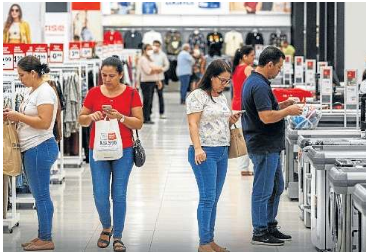
No resultado acumulado do ano, o avanço é de 2,4%

vestuário e calçados permaneceu estável na comparação com fevereiro.