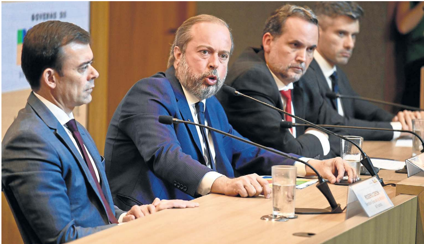
Na coletiva de imprensa, o ministro Silveira conclamou as distribuidoras a “fazerem a sua parte” para evitar a elevação de preços

já que está associada à maior arrecadação com o petróleo. Portanto, a MP não irá desrespeitar a lei e terá efeito neutro. “A premissa da neutralidade fiscal, a premissa da cautela de sempre, as medidas a serem feitas para um período de tempo, tudo para elas poderem ser reavaliadas”, frisou ele.