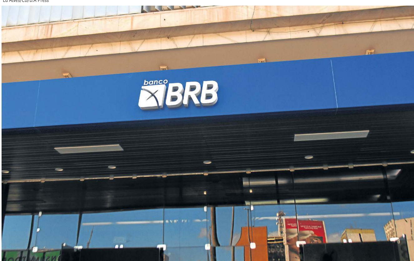
O BRB enfrenta uma corrida contra o tempo para concluir o processo de capitalização e apresentar o balanço financeiro