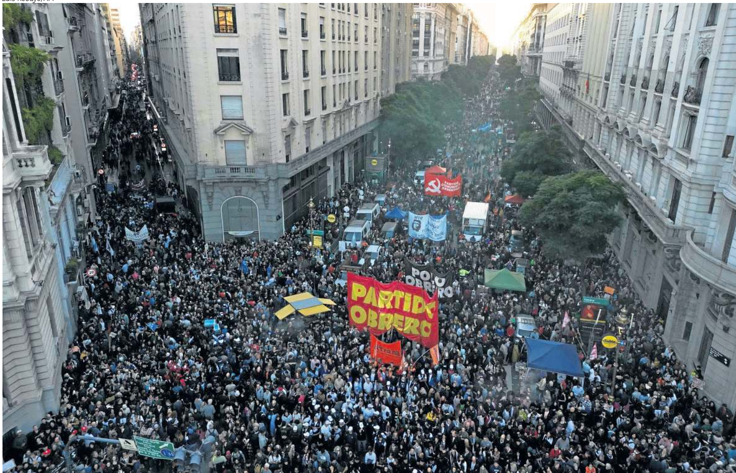
Estudantes e funcionários de universidades marcham em direção à Plaza de Mayo, em ato contra as políticas do presidente Javier Milei

no tratamento de pacientes com câncer. Dos 18 centros cirúrgicos, apenas seis ou sete estão funcionando. O restante está desativado, pois é necessário um orçamento para fazer os repartos, e esse dinheiro não existe", acrescentou a subsecretária.