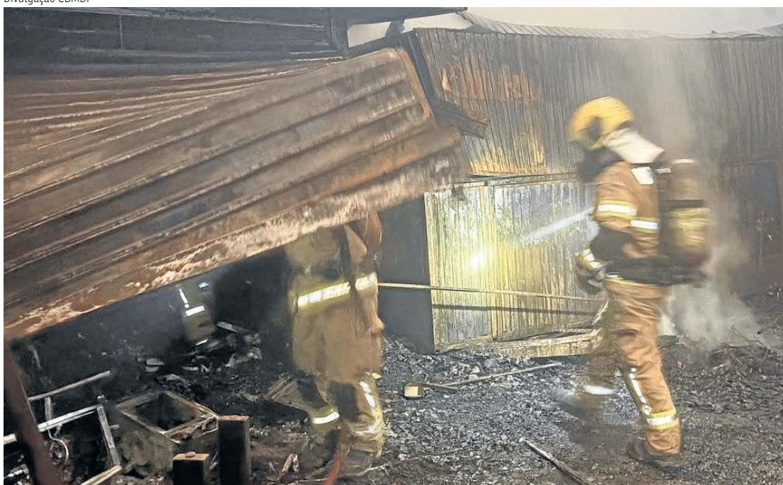
Incêndio mobilizou equipes do Corpo de Bombeiros Militar do Distrito Federal

trabalha na feira desde 1997 e passou a manhã tentando descobrir se a banca onde eles vendem utilidades domésticas e acessórios automotivos havia sido atingida.