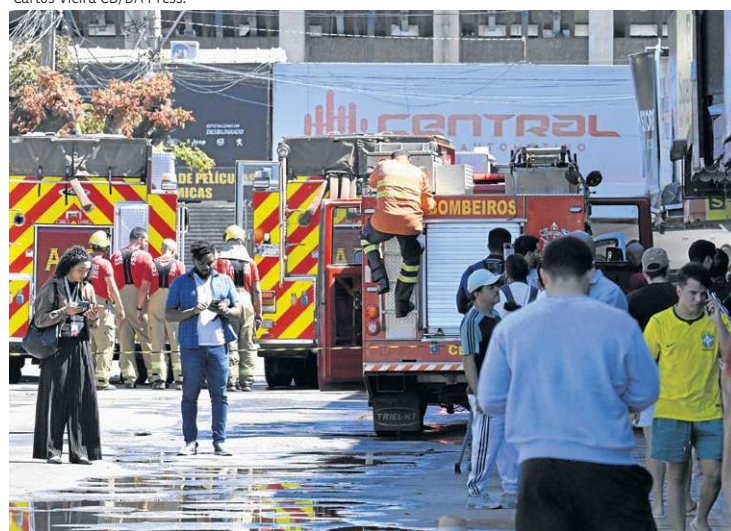
Bombeiros falam da necessidade de prevenção para evitar acidentes