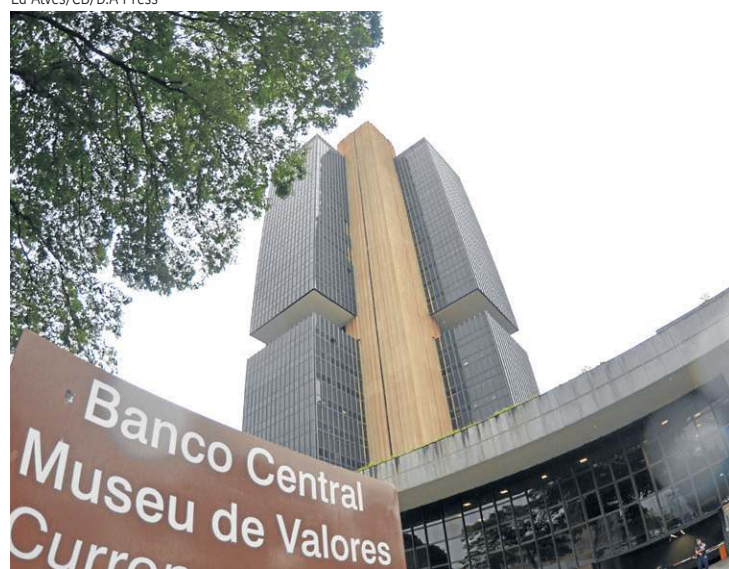
Para analistas ouvidos pelo Banco Central, o IPCA ficará em 4,91% este ano

economia americana como “danosas” para as expectativas inflacionárias globais.