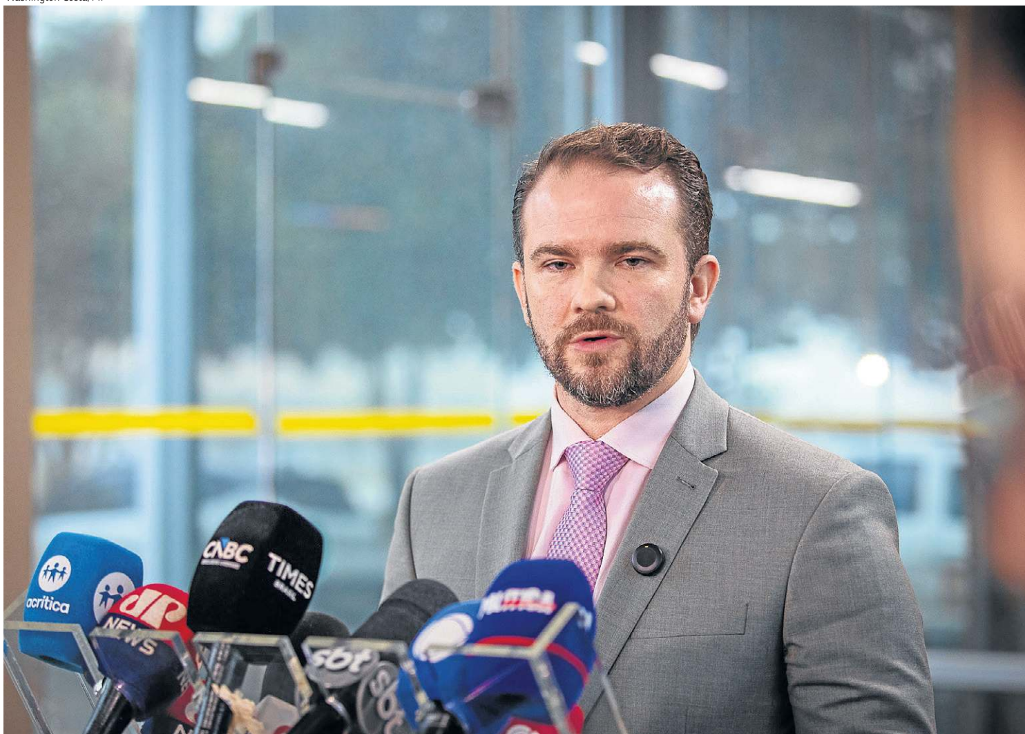
Em conversa com jornalistas, Durigan avaliou como positivas as operações realizadas até agora e disse que os inadimplentes serão contemplados

Ao fazer o primeiro balanço do Novo Desenrola, o ministro da Fazenda, Dario Durigan, afirmou, ontem, que quase R$ 1 bilhão em dívidas foi renegociado, em praticamente 100 mil pedidos fechados, entre 200 mil realizados. Os outros seguem sendo analisados pelas instituições financeiras e estão “praticamente fechados”, segundo Dario.