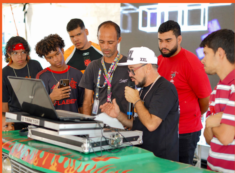
Oficina da DJ — Ceilândia