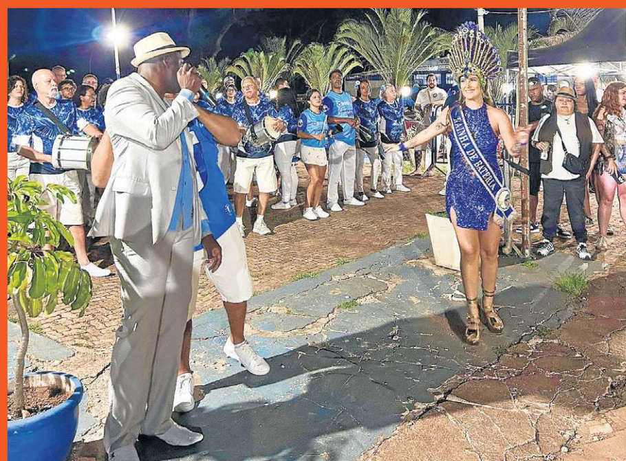
Apresentação na Aruc