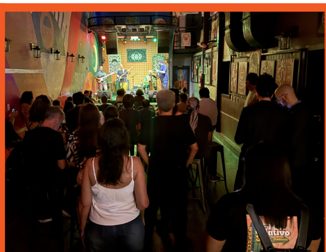
Show de jazz — Infinu

GURULINO Humor contemplativo & espirituoso por Pedro Sangeon