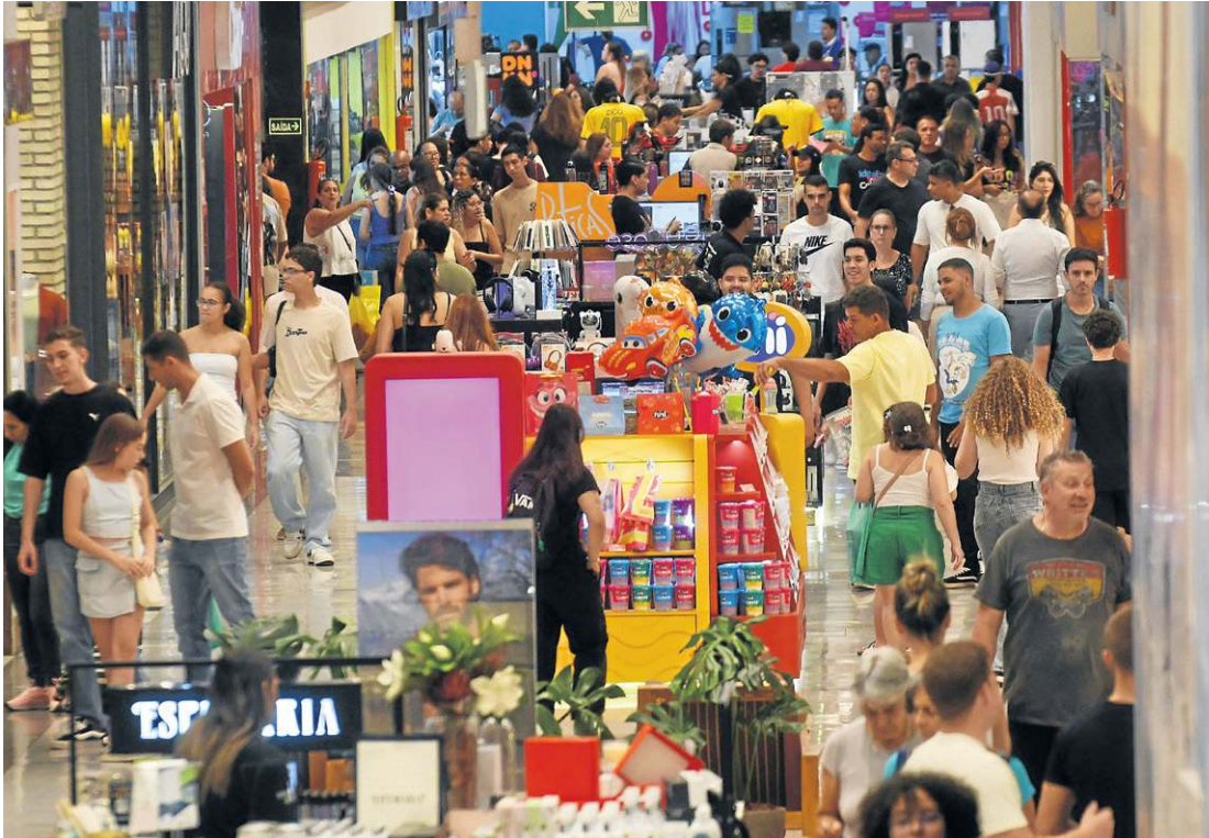
Os corredores do Conjunto Nacional registraram grande movimentação na véspera do Dia das Mães