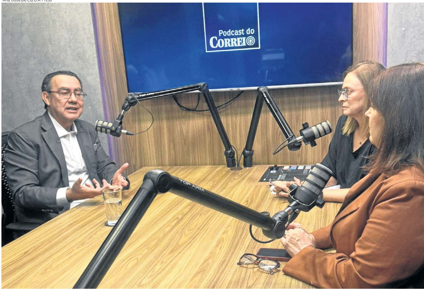
Ao comentar a disputa eleitoral, Augusto Cury disse que pretende defender o diálogo e reduzir a polarização política

O escritor, professor, psiquiatra e pré-candidato à Presidência da República Augusto Cury afirmou que a sociedade atravessa uma crise emocional marcada pelo excesso de estímulos digitais, pela hiperconectividade e pelo enfraquecimento das relações humanas.