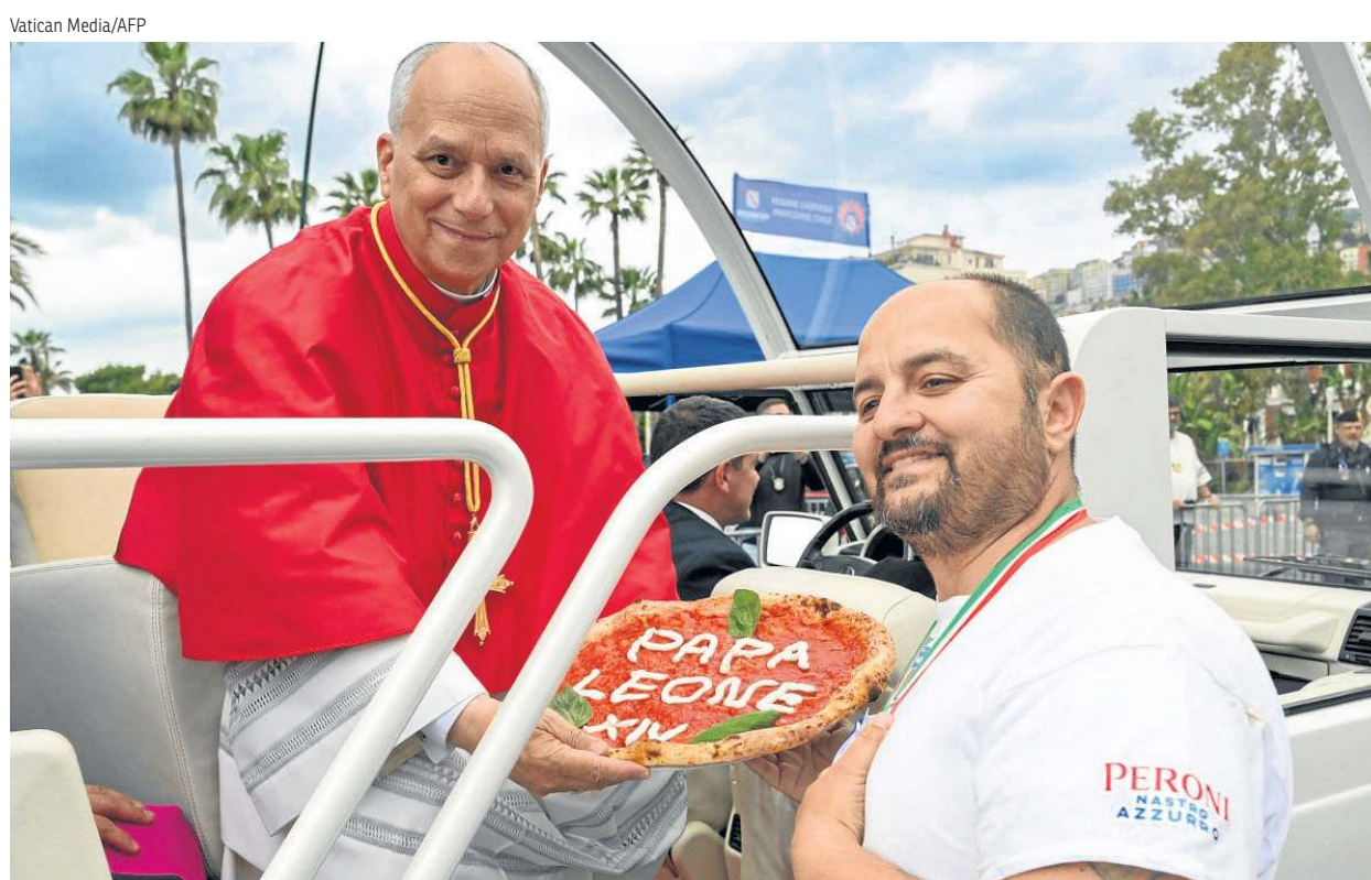
Pizza para o papa — No primeiro aniversário do pontificado, Leão XIV viajou para Pompeia e Nápoles, onde foi recebido com o prato mais tradicional da cidade (e da Itália). Pizzaria famosa presenteou o pontífice. PÁGINA 9

PÁGINAS 3 E 4. BRASÍLIA-DF, 4, E EIXO CAPITAL, 14