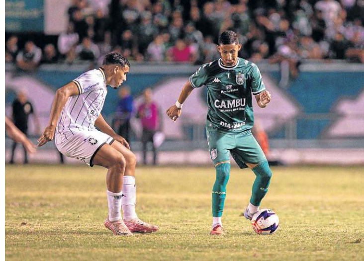
O Gama começou bem, sofreu gol, pressionou, mas não reagiu em casa