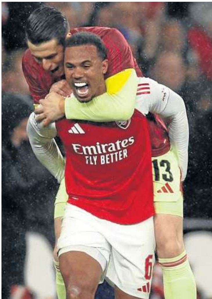
Gabriel e Arsenal podem unificar Liga dos Campeões e Premier League

defensores, PSG e Arsenal seguem caminhos distintos. O mantra do time francês passa pela marcação alta, pressão constante e verticalidade para manter a bola distante da própria área. A consequência aparece nos números: são 44 gols marcados em 16 jogos nesta edição da Champions League.