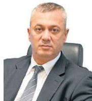
» FÁBIO MEDINA OSÓRIO Advogado, ex-ministro da Advocacia-Geral da União

A colaboração premiada pode consolidar-se como um instrumento estratégico no enfrentamento à criminalidade econômica organizada, mas seu uso não pode ser desvirtuado e tampouco dissociado de outros métodos investigativos. Sua eficácia institucional não advém da mera acumulação de depoimentos de colaboradores e muito menos de colaborações cruzadas, mas da forma cirúrgica como os relatos são colhidos e o colaborador aporta informações e documentos ao conhecimento das autoridades. O objetivo estratégico da autoridade deve ser atingir o topo da pirâmide da criminalidade por meio da colaboração de alguém que detenha informações e documentos relevantes, para formar um caminho investigativo consistente.