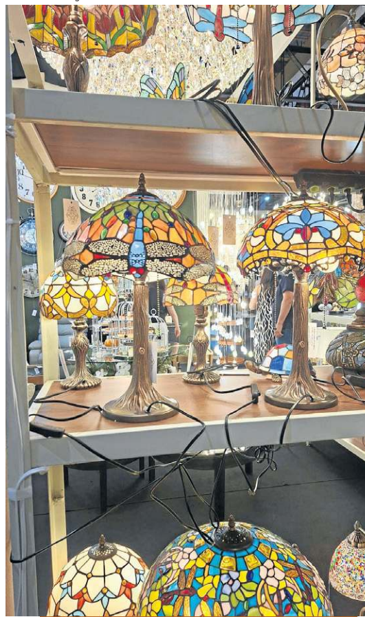
Os tradicionais abajures inspirados no estilo art déco são um charme à parte

e cheia de personalidade, sem pesar visualmente o espaço. Em mobiliário, ele aparece como detalhe em portas de armários, cristaleiras ou até em painéis decorativos, trazendo um toque artístico único. "O mais interessante é que o vitral deixa de ser apenas um elemento funcional e passa a ser protagonista, quase como uma peça de arte dentro do ambiente", elogia.