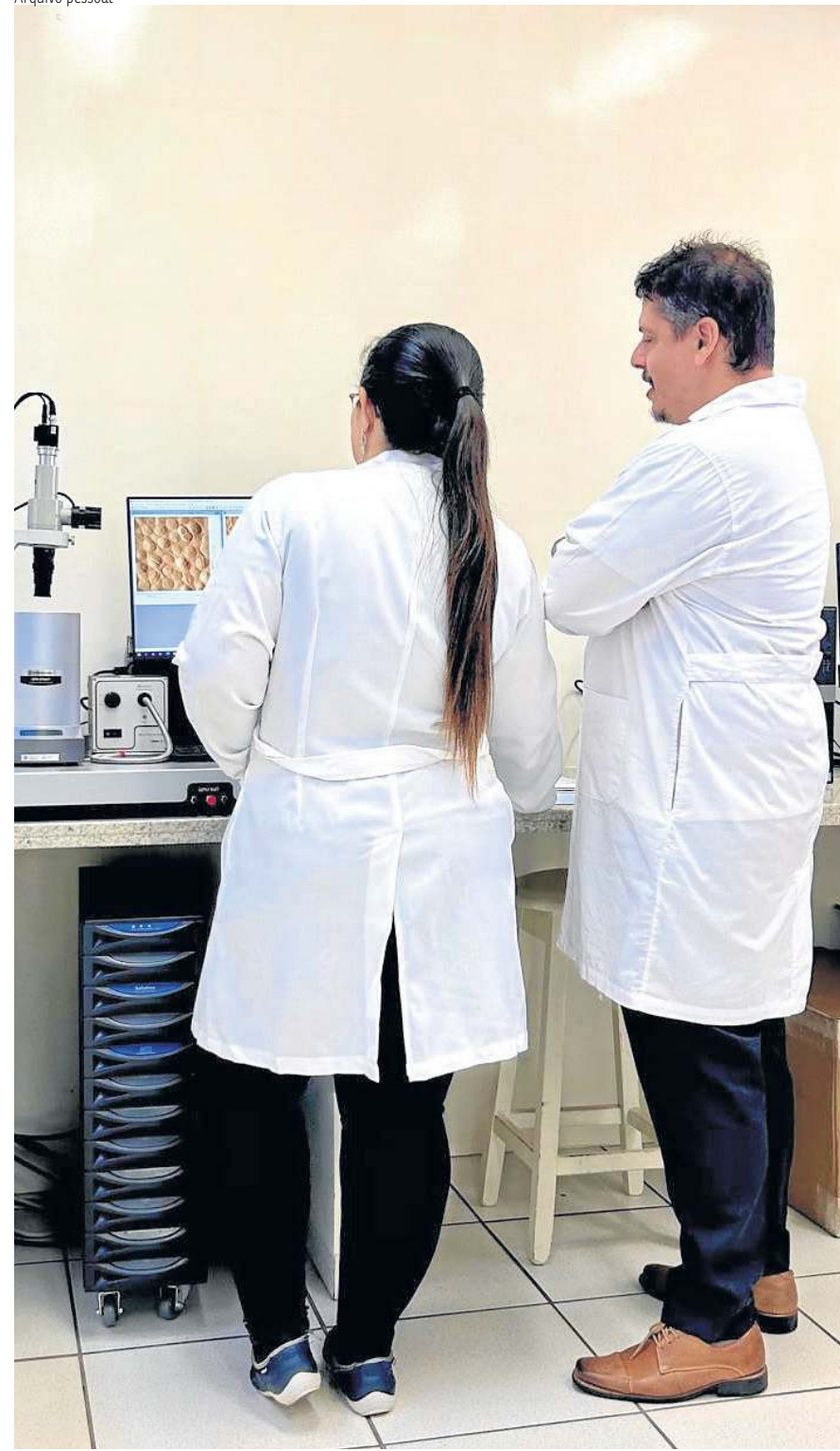
Os cientistas da Católica realizaram um experimento evolutivo in vitro