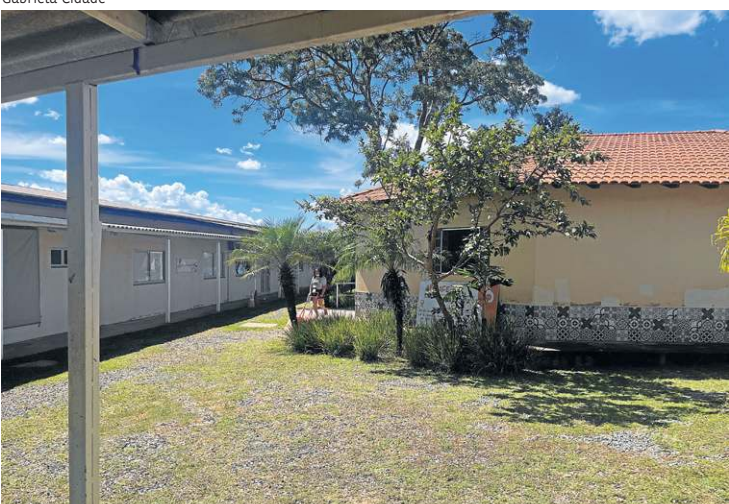
Associação fica na QE 25 no Guarã II e atende a 911 famílias

surgiu primeiro na sigla. Depois, o significado foi construído.