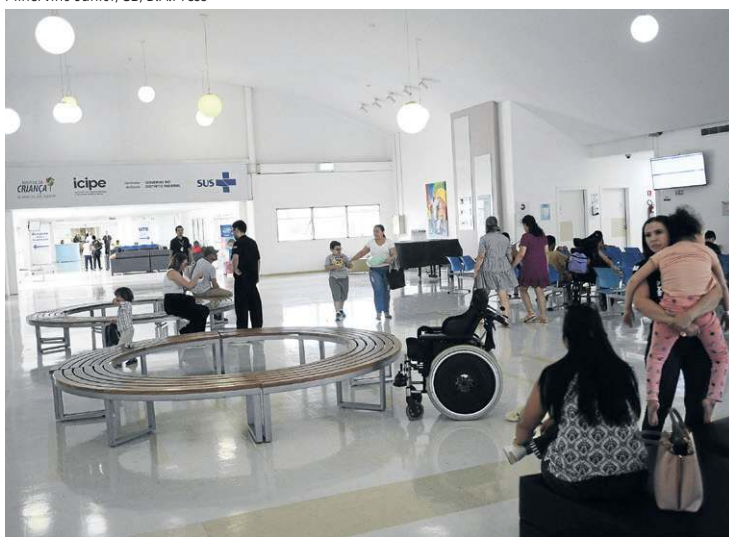
Hospital da Criança de Brasília José Alencar, fundado pela Abrace