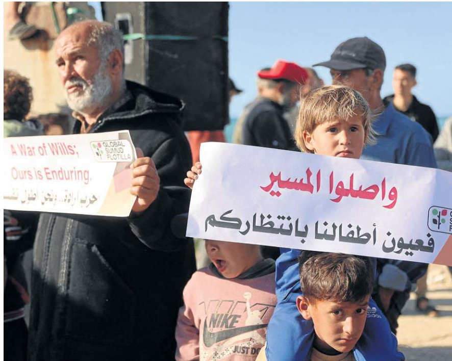
Palestinos exibem cartazes em apoio à navios abordados com ajuda humanitária

Governos europeus manifestaram “preocupação” e cobraram “respeito ao direito internacional” depois de Israel ter anunciado, ontem, que interceptou cerca de 20 embarcações que integram uma flotilha com mais de 50 barcos a caminho do território palestino da Faixa de Gaza. O chanceler Gideon Saar confirmou a detenção de 175 ativistas, que seriam “levados para a Grécia nas próximas horas”, após um acordo com o governo de Atenas. A abordagem foi executada entre a costa grega e a da ilha greco-turca de Chipre, em águas internacionais, e gerou protestos.