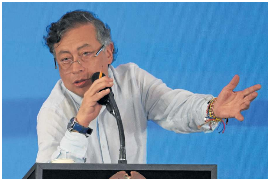
O presidente Gustavo Petro em campanha para eleger Iván Cepeda como sucessor