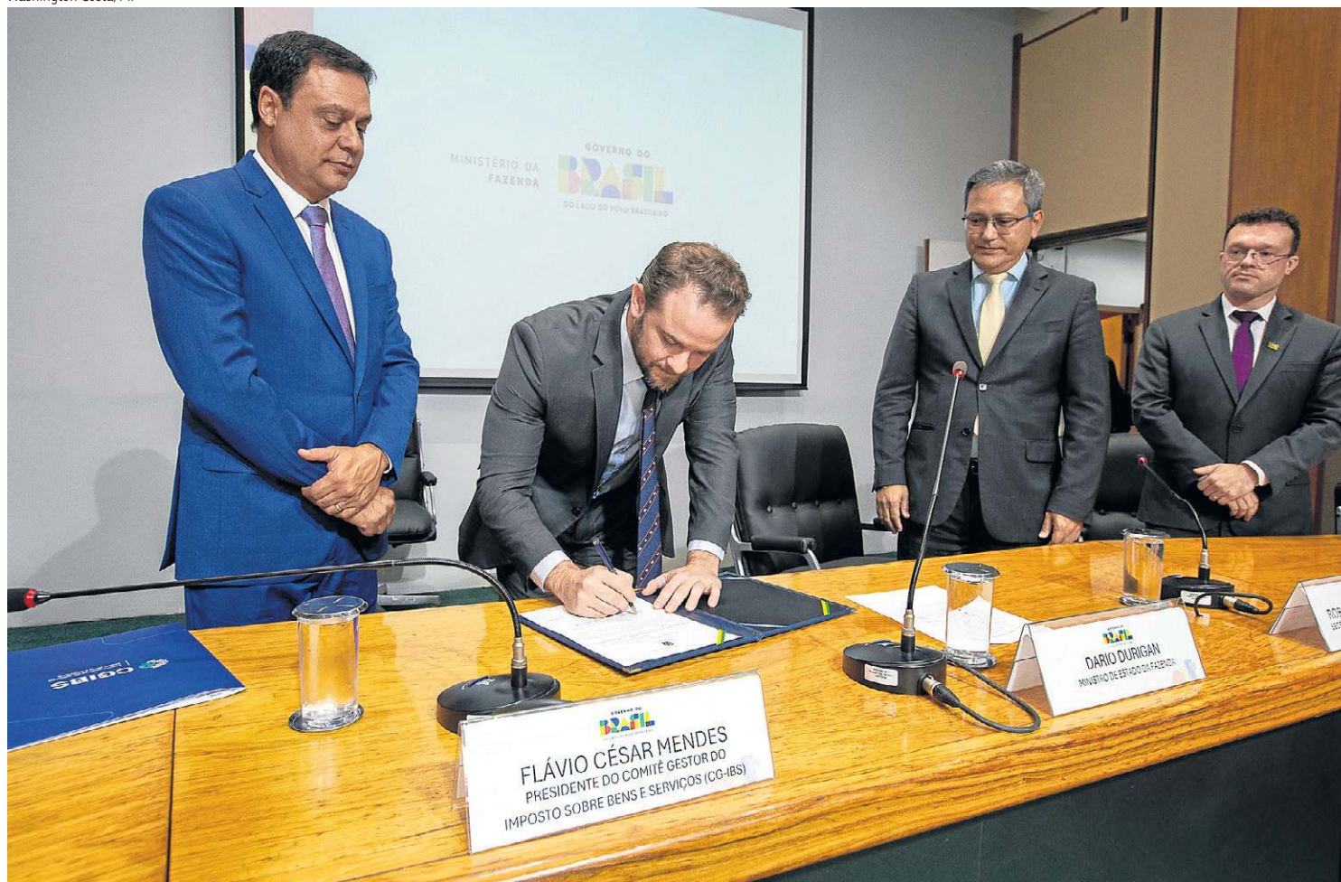
Ministro da Fazenda, Dario Durigan assina o decreto que regulamenta o Imposto sobre Bens e Serviços (IBS), de incidência do governo federal

O governo divulgou, ontem, as regras que tratam sobre os impostos estabelecidos com a reforma tributária sobre o consumo. No caso da Contribuição sobre Bens e Serviços (CBS), que será administrada pela União, o regulamento foi divulgado pelo próprio governo federal, enquanto que o Imposto sobre Bens e Serviços (IBS) foi lançado pelo Comitê-Gestor do IBS.