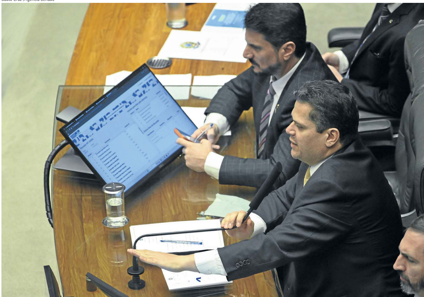
Alcolumbre é acusado pela base do Planalto, desde a sessão que rejeitou Messias no STF, de ter fechado um acordão com os bolsonaristas

e evitar distorções no sistema penal. “Pena justa não é favor, é direito. E quando o Estado exagera na pena, ele deixa de fazer justiça e passa a cometer injustiça”, disse.