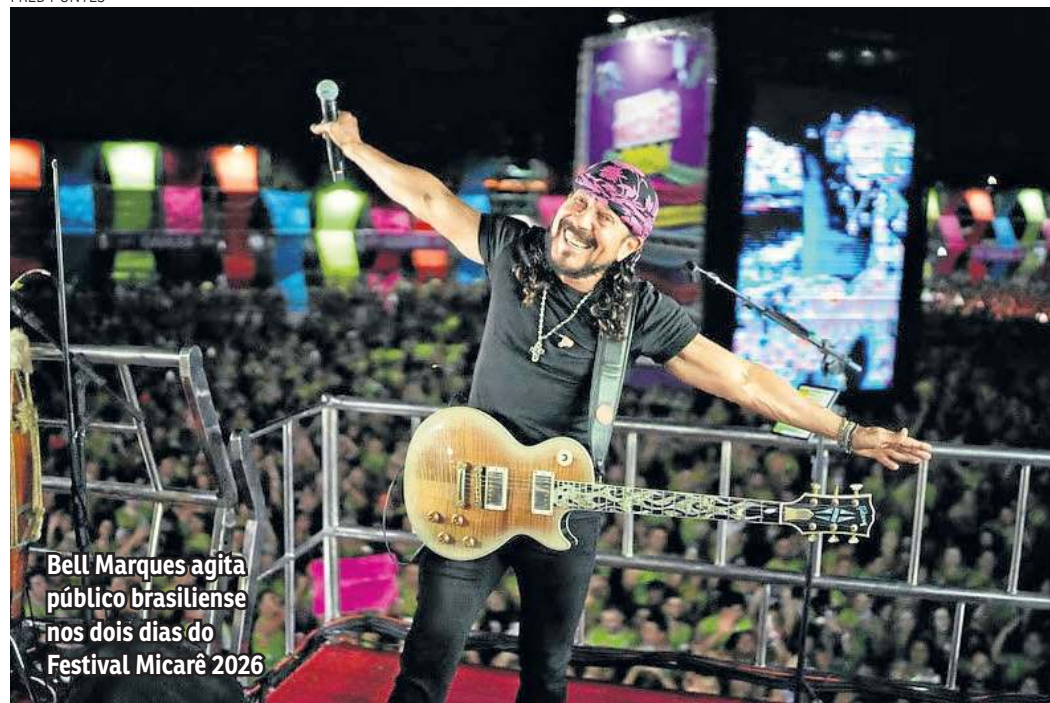
Bell Marques agita público brasiliense nos dois dias do Festival Micarê 2026

Unindo grandes nomes do axé e novos representantes do ritmo, o evento revive, desde 2019, a nostalgia das famosas Micarecandangas,