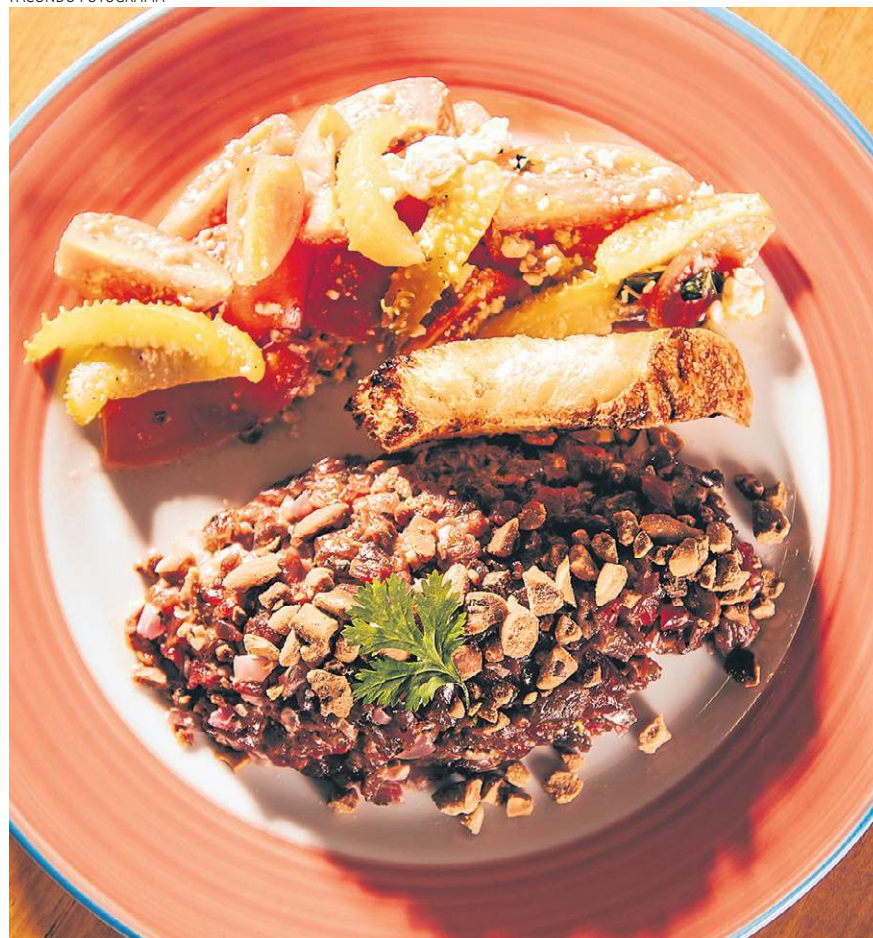
Steak tartare de carne de sol da Casa Baco