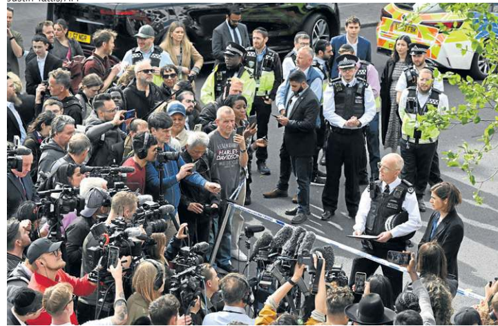
A polícia londrina cerca a área do ataque: onda de antisemitismo

ele expressa a mais sincera gratidão àqueles que prestaram ajuda de forma tão altruísta”, afirmou um porta-voz do monarca.