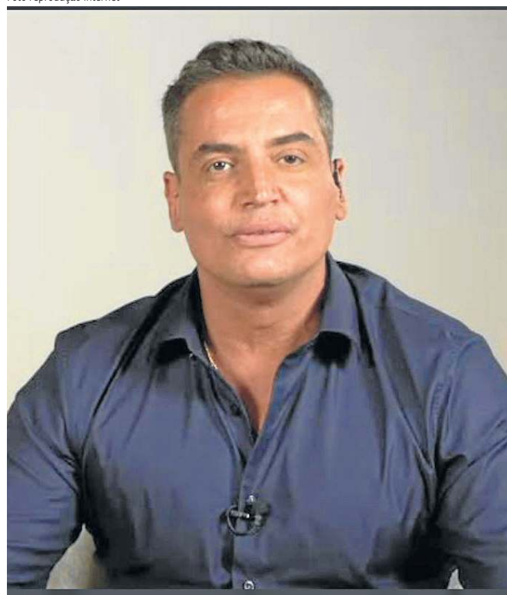
O comunicador teria recebido pelo menos R$ 9,9 milhões do Master