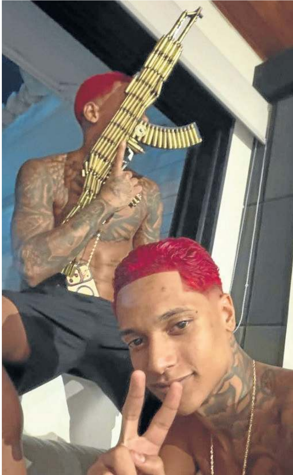
Oruam está foragido desde que o STJ suspendeu a liminar que o mantinha em liberdade