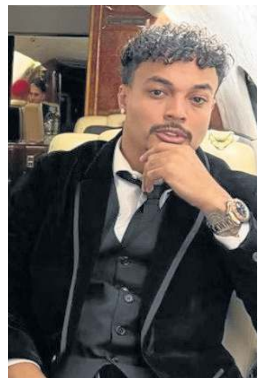
Lucca também atuaria na lavagem de dinheiro