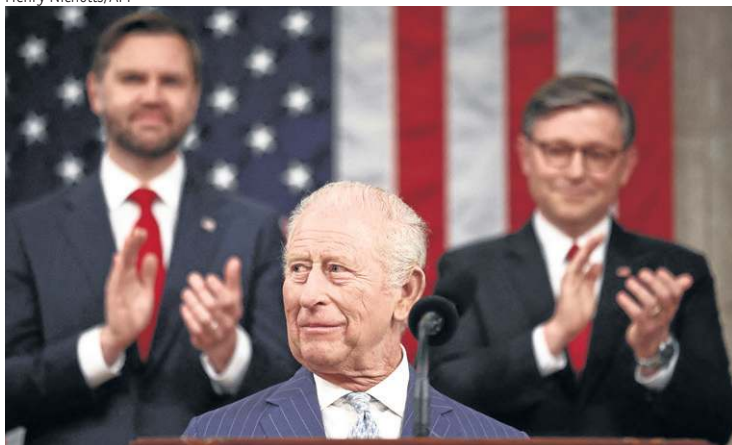
J.D. Vance (E), vice-presidente americana, aplaude o monarca (C)

último sábado. "Deixem-me dizer com resolução inabalável: tal ato de violência jamais será bem-sucedido", avisou, ao ressaltar que o ataque tentou fomentar ainda mais o medo e a discórdia. Mais uma vez, o rei enalteceu a amizade entre os dois povos e países. "Quaisquer que sejam nossas diferenças, quaisquer discordâncias que possamos ter, permanecemos unidos no nosso compromisso em defesa da democracia", declarou. Também destacou a relação sólida entre Reino Unido e EUA.