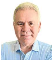
» MARCELO QUEIROGA Médico cardiologista e ex-ministro da Saúde

em doenças raras. Esse arcabouço não apenas organizou o processo decisório, como abriu caminho para soluções inovadoras.