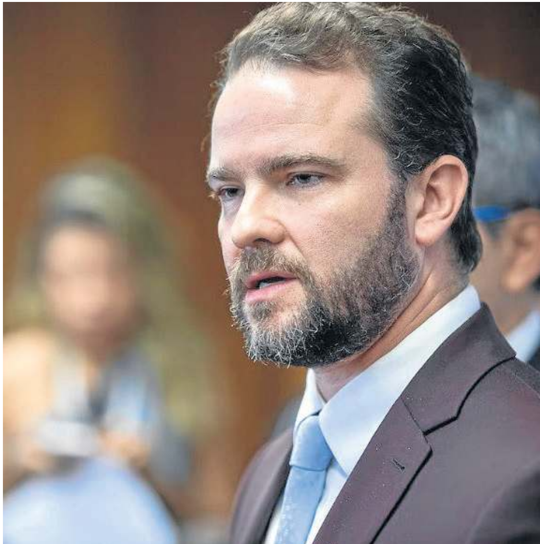
Durigan: programa Desenrola 2.0 será temporário e envolve uso do FGTS para renegociar dívidas