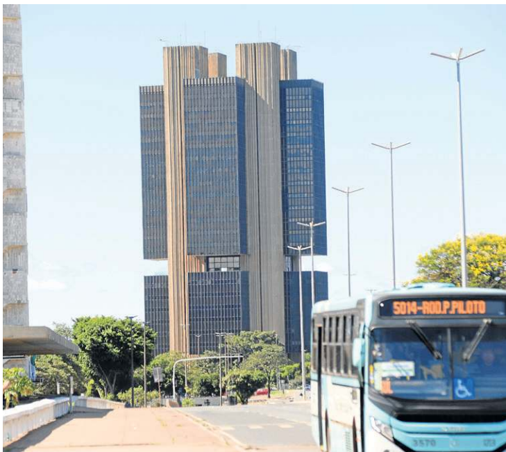
Segundo o Banco Central, endividamento das famílias chegou a 49,9%