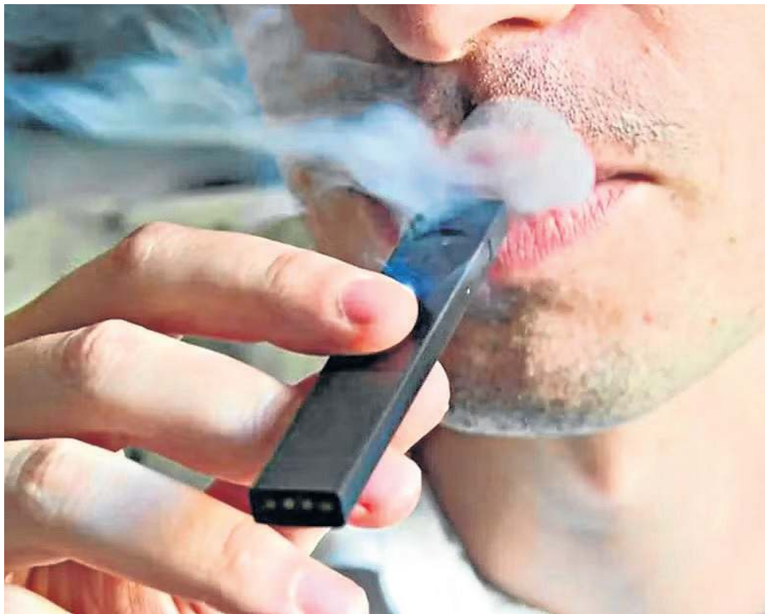
Consumo de vape: especialistas apostam em conversas presenciais para alertar os usuários dos riscos

está preparado para metabolizar", alerta o especialista.