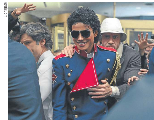
Michael aborda a trajetória do pop star desde a infância

A trajetória do rei do pop acaba de chegar às telonas. Com direção de Antoine Fuqua e um orçamento de mais de US$ 150 milhões o filme Michael aborda a história do artista desde o início da carreira, no Jackson 5 com os irmãos, até alcançar o mundo. Amadas e odiadas por muitos, as cinebiografias são um gênero de muito sucesso de bilheteria e, quando bem feitas, destacam-se até mesmo em premiações.