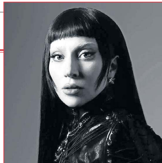
Lady Gaga optou pelo estilo microbangs