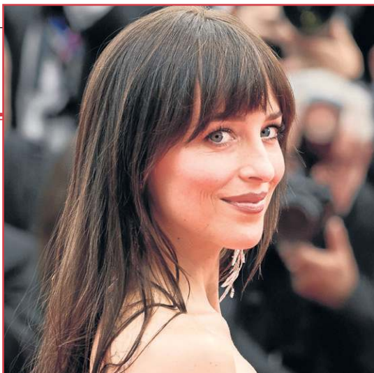
A atriz Dakota Johnson ostenta franjas desde criança