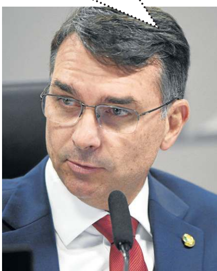
Ed Alves/CB/DA Press