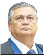
» FLÁVIO DINO Ministro do Supremo Tribunal Federal

Ingressei na magistratura federal em concurso público realizado em 1993/1994. Em uma análise comparativa entre o ontem e o hoje sobre corrupção no Sistema de Justiça, algo continua igual: a imensa maioria dos integrantes das carreiras jurídicas está longe desse mal, sem “comprar”, “vender” ou falsificar decisões, pareceres, indiciamentos etc. Contudo, três aspectos mudaram para pior: o primeiro, a quantidade de casos aumentou; o segundo, esses casos se tornaram mais graves, envolvendo elevados montantes e sofisticadas redes de lavagem (inclusive fundos de mercado); e, por fim, aumentou o exibicionismo dos ímprobos.