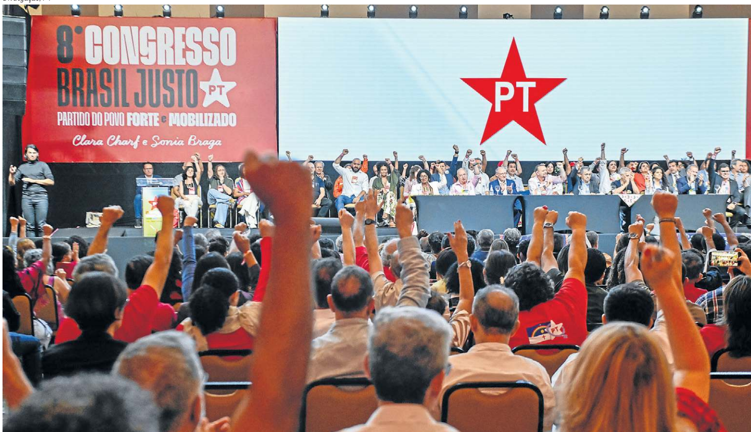
O programa do Partido dos Trabalhadores destaca que as eleições serão novamente um embate da democracia contra a ditadura

organizar a resistência contra a hegemonia financeira e a extrema-direita", destaca.