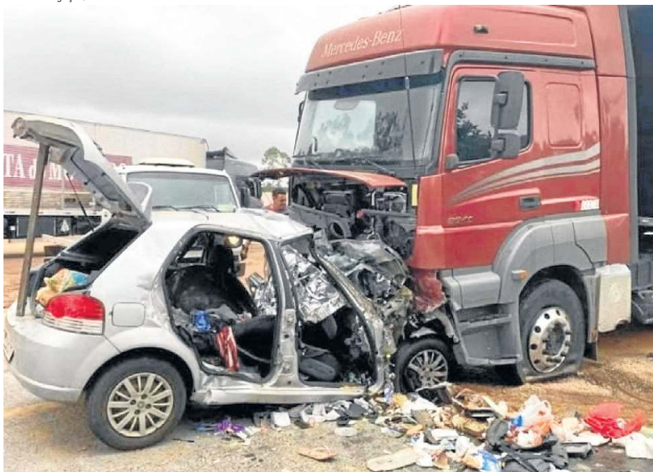
Fiat Palio com placa de São Paulo seguia para a Bahia. Ninguém sobreviveu ao acidente