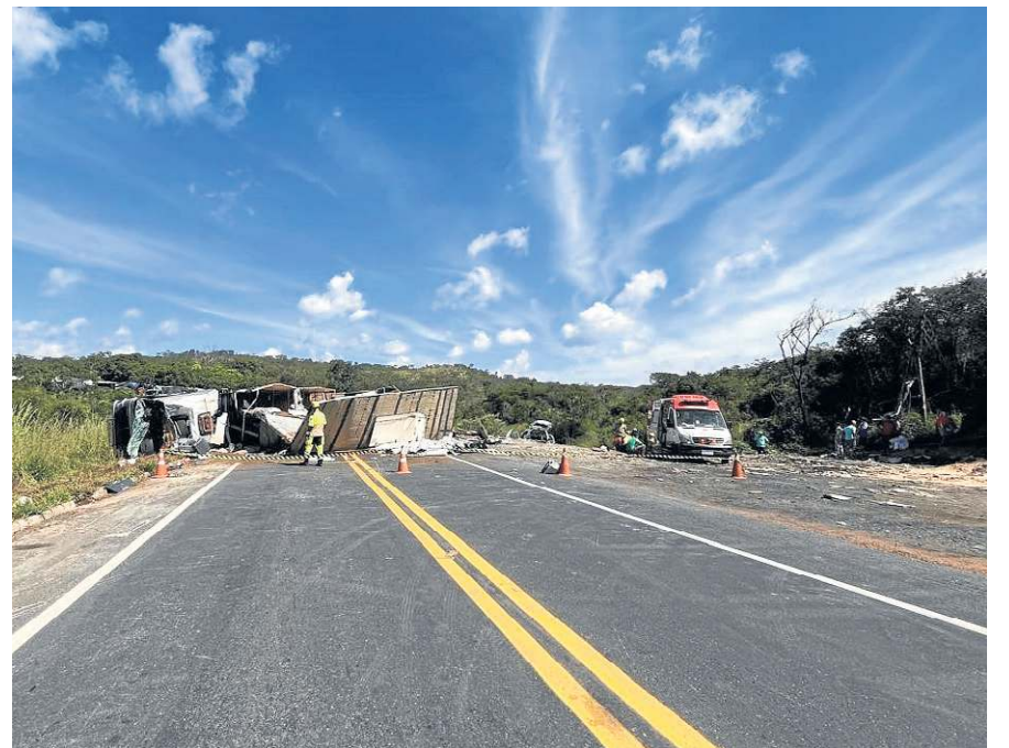
No sábado, carreta bitrem tombou sobre dois veículos. Matou dois e feriu oito pessoas

Dois desastres entre veículos de carga e de passeio, com oito mortos e oito feridos, fizeram da BR-251, no norte de Minas Gerais, a estrada mais mortal do feriado prolongado do Dia de Tiradentes. Mas a violência nas rodovias esteve em todos os dias do recesso. São 18 óbitos do sábado até ontem.