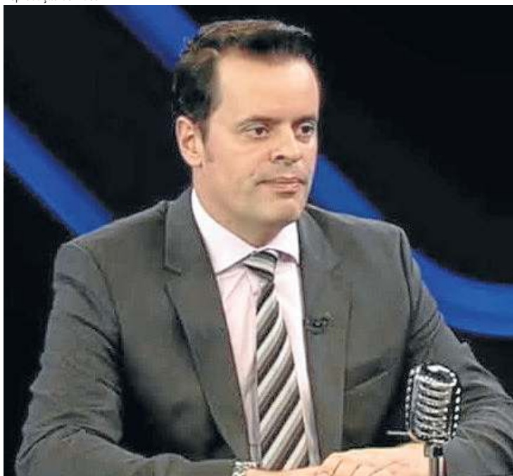
Delegado da PF foi designado como oficial de ligação junto ao ICE

Em janeiro, um pedido de extradição foi enviado pelo Ministério da Justiça ao Departamento de Estado norte-americano. A detenção de Ramagem pelo ICE — que durou apenas 48 horas — não teve ligação com este pedido e tratou apenas de questões migratórias.