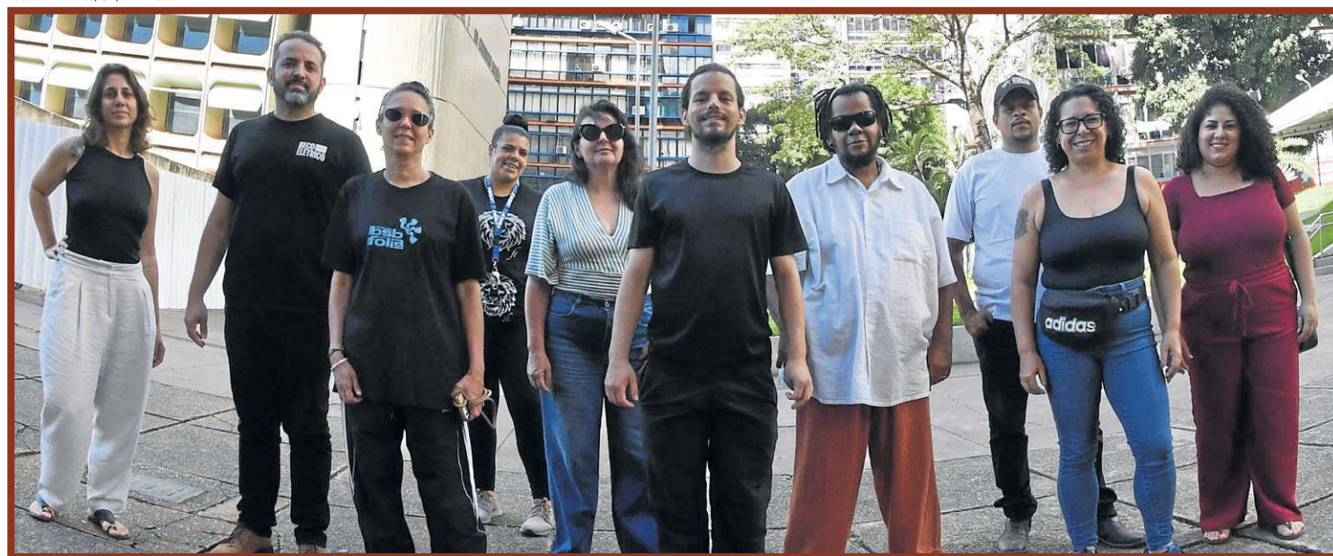
O No Setor propõe ocupar o Setor Comercial Sul por meio de projetos sociais e culturais

“Numa cidade que tem envelhecido e que temos cada vez mais