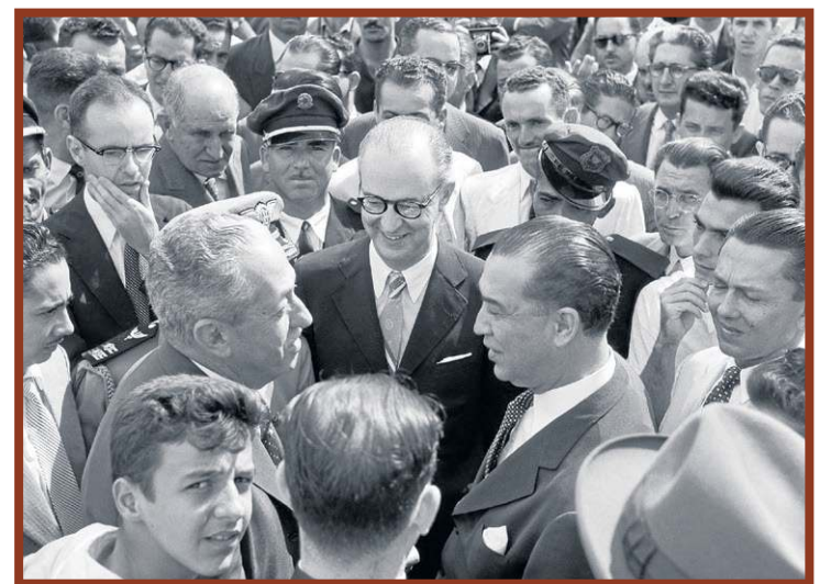
Palácio do Planalto (acima); trabalhadores plantam grama em frente ao Brasília Palace Hotel; JK conversa com Israel Pinheiro no aeroporto