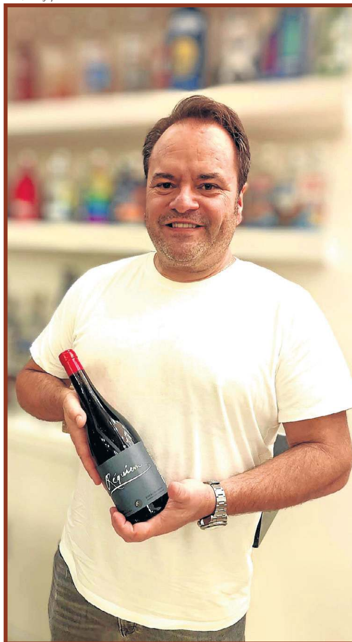
A Del Maipo tem um estoque de mais de 800 mil garrafas