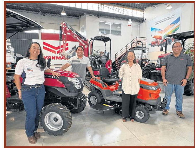
Terceira geração à frente da Casa Hanashiro

é ajudar na modernização da agricultura do DF, de empreendimento familiar à colheita familiar. De acordo com a Hanashiro, a agricultura da região deve investir em novas tecnologias, que otimizem as pequenas produções que crescem no espaço limitado do DF.