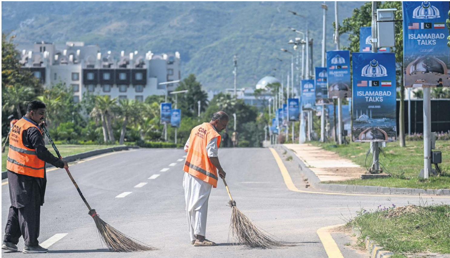
Preparativos para receber outra rodada de conversações em Islamabad: cessar-fogo se aproxima do fim sem sinais de acordo de paz definitivo

O Paquistão preparava-se ontem para receber mais uma rodada de negociações de paz entre Estados Unidos e Irã, uma semana depois de uma primeira investida diplomática — frustrada — em busca de um acordo capaz de encerrar o conflito iniciado em 28 de fevereiro. A Casa Branca confirmou a presença do vice-presidente J. D. Vance, aguardado na capital paquistanesa, Islamabad, na noite de hoje, à frente de uma delegação que deve incluir o enviado especial Steve Witcoff e o genro do presidente Donald Trump, Jared Kushner. Da parte iraniana, já na madrugada de hoje (horário local), a imprensa oficial indicava que “não havia planos” de participar do encontro. Na quarta-feira expira o cessar-fogo de 15 dias anunciado na noite do último dia 7, a poucas horas de um ultimato em que Trump ameaçava “exterminar a civilização” persa.