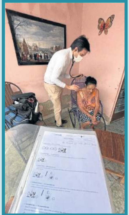
Desenhos que traduzem cuidado médico em ações claras para o paciente