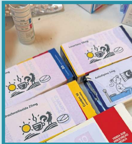
Pela manhã, a receita deve ter os ícones do sol, do galo e da xícara de café