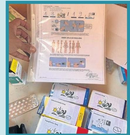
Ícones como sol, café e alimentos, ajudam a guiar o tratamento