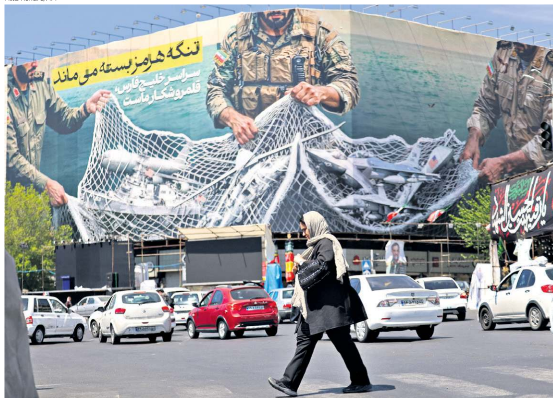
Cartaz em Teerã anuncia que Ormuz "continua fechado": regime islâmico aposta no impacto econômico