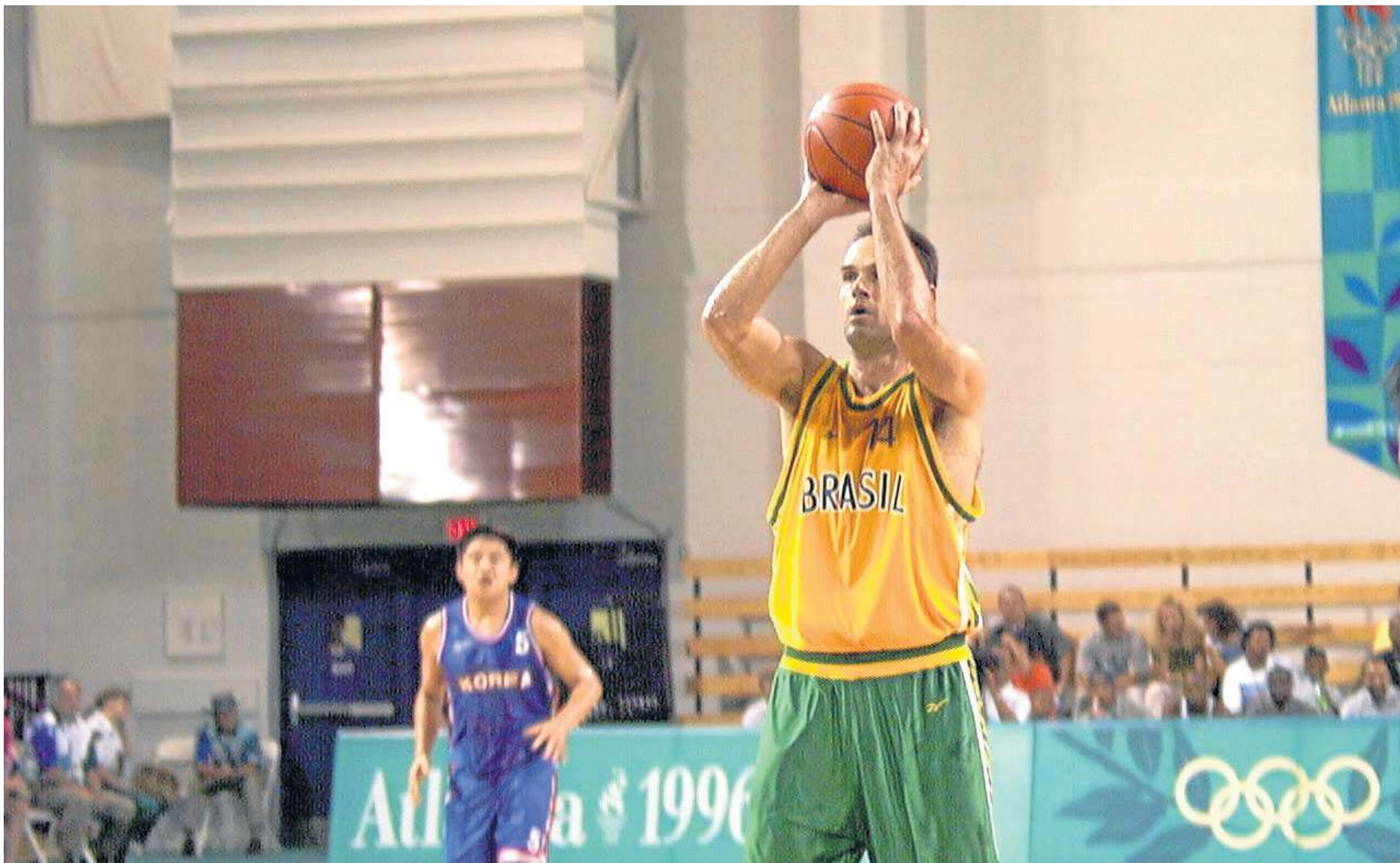
Oscar Schmidt em ação na quinta e última participação em Jogos Olímpicos, em Atlanta-1996, nos EUA: nove anos depois do ouro no Pan, anotou 219 pontos naquela edição

Como em um lance livre, o planeta bola parou novamente para celebrá-lo nos quatro cantos do planeta basquete. Considerado um dos jogadores mais dominantes da história da NBA, o pivô Shaquille O'Neal, dono de quatro títulos