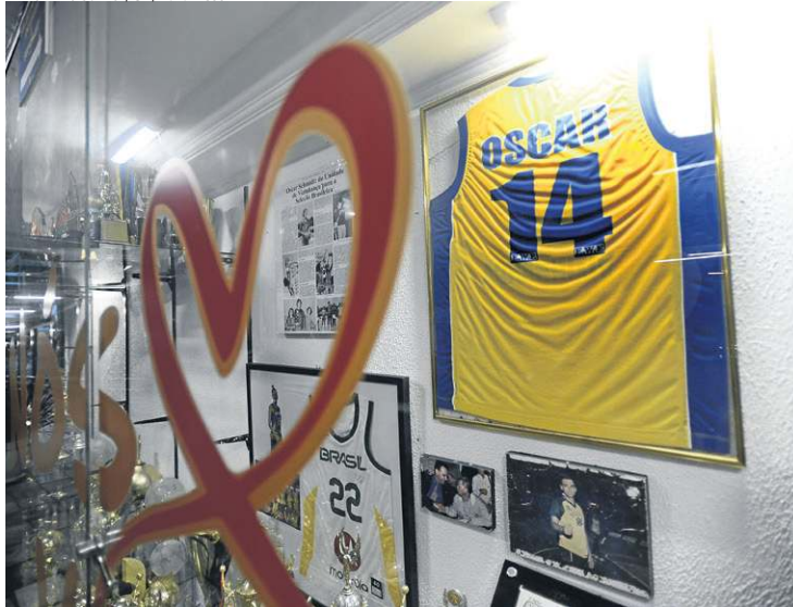
Lendária camisa 14 do atleta está exposta na entrada do Vizinhança