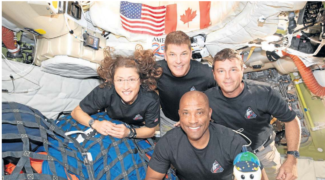
Tripulação do Artemis II: a especialista de missão Christina Koch; o especialista de missão Jeremy Hansen; o comandante Reid Wiseman; e o piloto Victor Glover