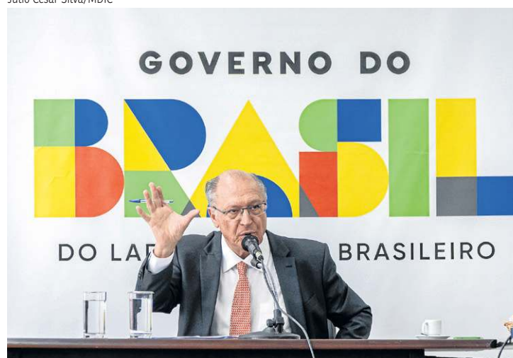
Alckmin diz que Brasil sobrano vai dispor R$ 15 bi para exportadores